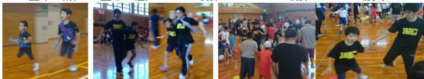
リレー眞一 景太郎 二人三脚 凜空 晏奈 風船割り 景太郎 前田