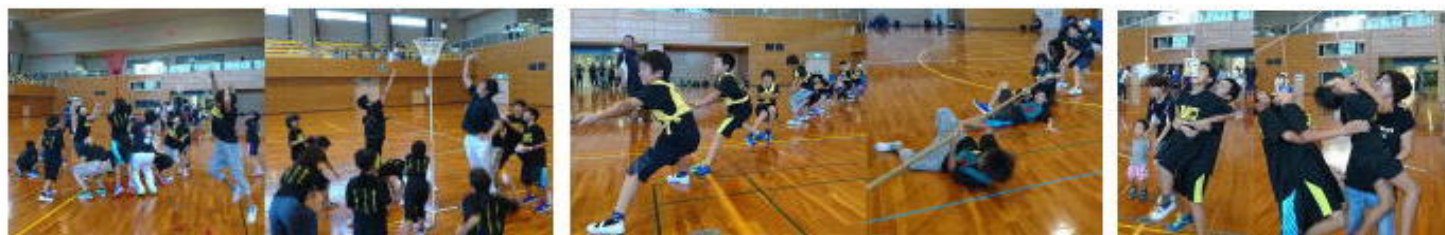
玉入れ（赤） 玉入れ（白） 綱引き 綱引き 親子リレー

4. スポーツ少年団親子交流会 9/10（日） 多治見市総合体育館第1競技場 スポ少の運動会が同じ、体育館で行われたので、野球チーム3チームと、空手の拳和会の4チームの闘いなので、毎年走る方は野球には勝てませんが、今年は高学年リレーでは3位になりました。