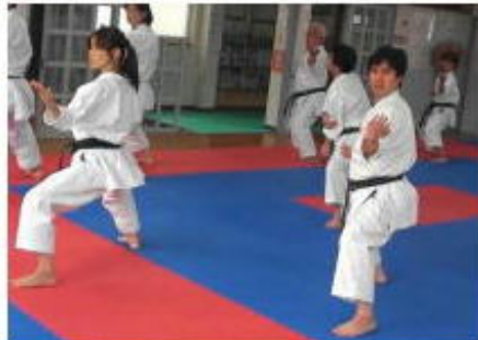
スーパーリンペイの指導