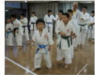
ピンポン球リレー 4