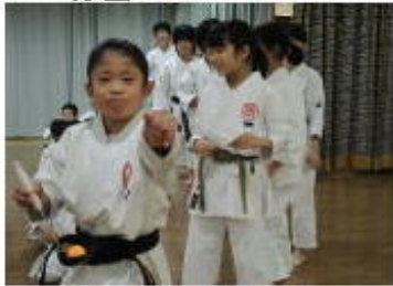
ピンポン球リレー 1