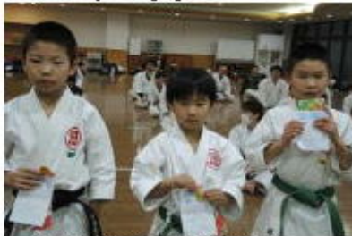
最優秀選手賞受賞者