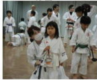
ピンポン球リレー 2