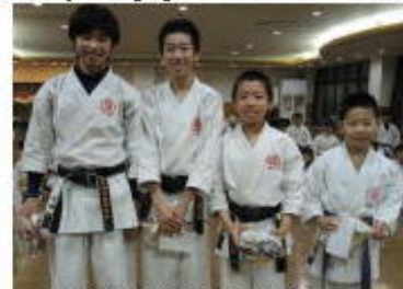
優秀選手賞受賞者