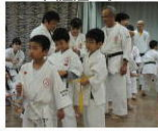
ピンポン球リレー 3